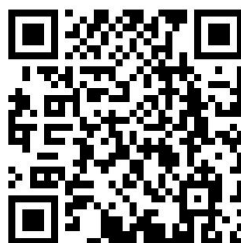
容缺受理承诺书（范本）